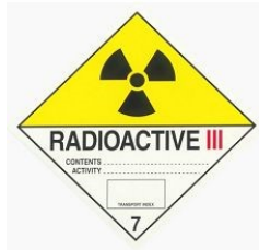
RRY - Категория III