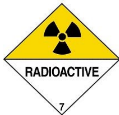
Радиоактивный материал (на контейнер)