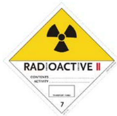
RRY - Категория II